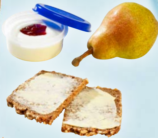
Schwarzbrot, Birne und Naturjoghurt mit Marmelade