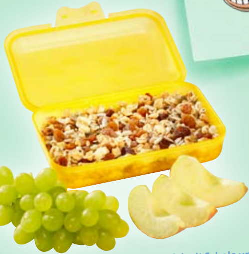
Müslis ohne Zucker & Schokolade, Apfel mit Schale und Weintrauben