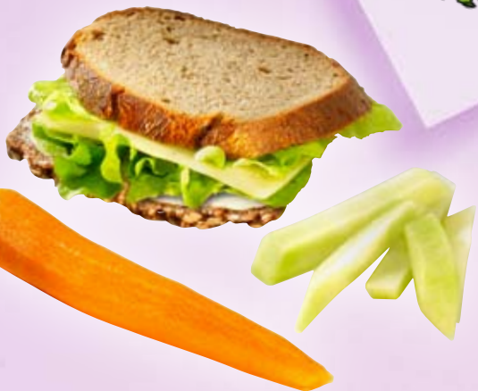
Schwarz- und Graubrot mit Käse und Salat, Möhre und Kohlrabi