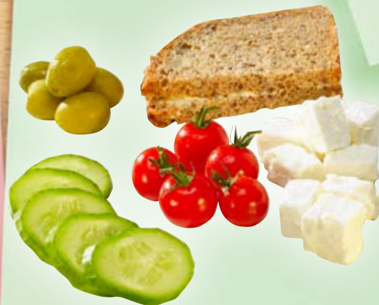
Mehrkornbrot, Schafskäse, Oliven, Gurke und Cocktailtomaten